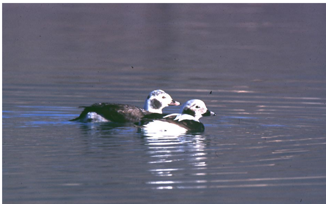
Morette codone Clangula hyemalis , Lago di Mezzola (SO0200), gennaio 2002