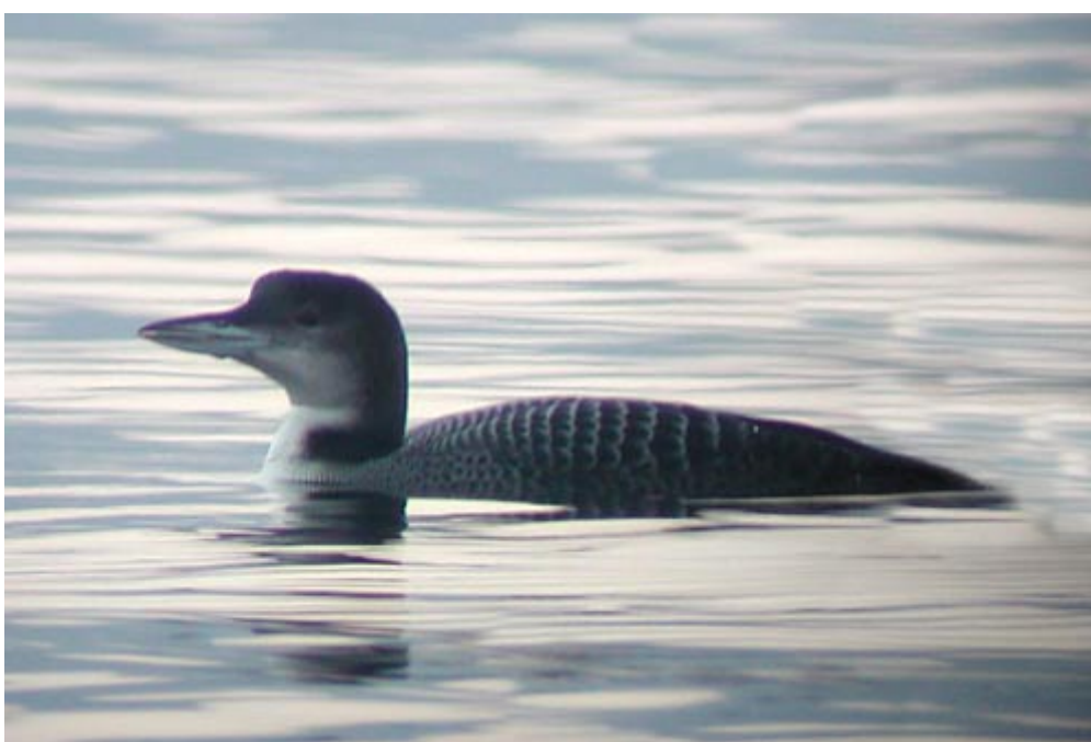
Strolaga maggiore Gavia immer, Lario Nord (CO0101/2), gennaio 2002